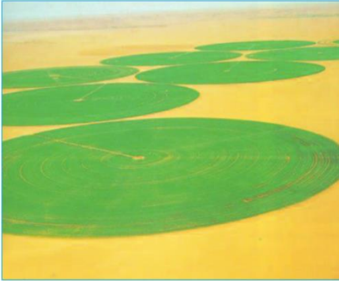
Hình 20.3 - Hệ thống tưới nước tự động, cải tạo hoang mạc thành đồng ruộng (Li-bi)