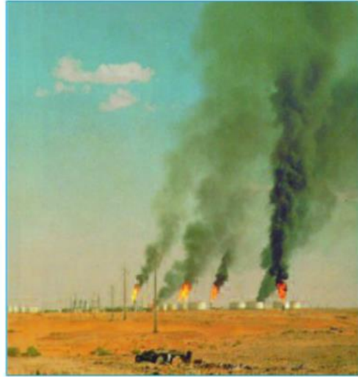
Hình 20.4 - Một khu khai thác dầu mỏ trong hoang mạc Xa-ha-ra (An-giê-ri)