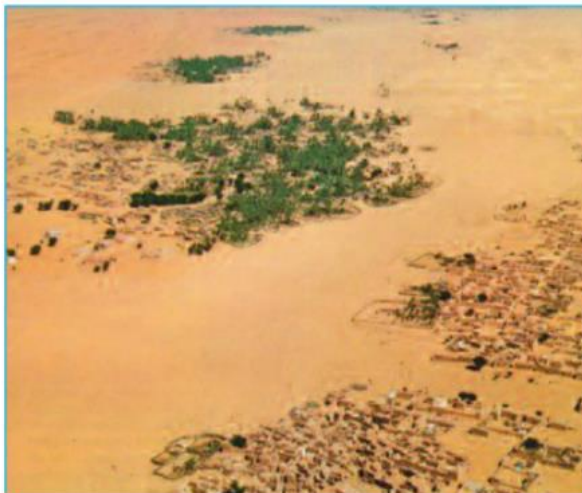
Hình 20.5. Một vùng đất ở hoang mạc Xa-ha-ra bị cát lấn