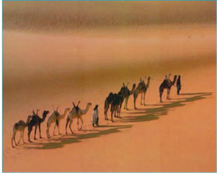
Hình 20.1 - Quang cảnh trong ốc đảo Hình 20.2 - Đoàn lạc đà chở hàng hoá qua hoang mạc