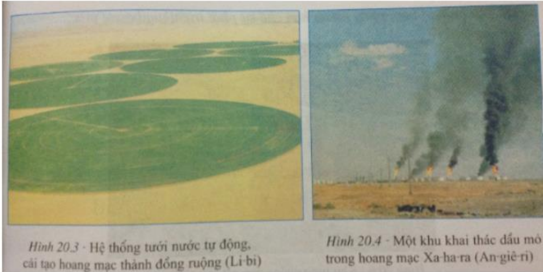
Hình 20.3 - Hệ thống tưới nước tự động, cải tạo hoang mạc thành đồng ruộng (Li-bi)