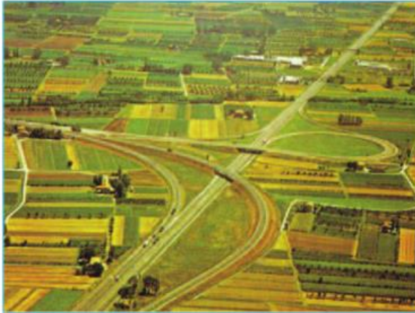
Hình 14.1 - Quang cảnh đồng ruộng ở I-ta-li-a