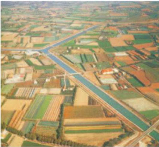
Hình 14.3 - Hệ thống kênh mương thủy lợi trên đồng ruộng