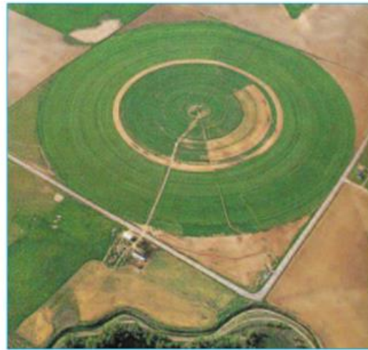
Hình 14.4 - Hệ thống tự động tưới xoay tròn trên đồng ruộng