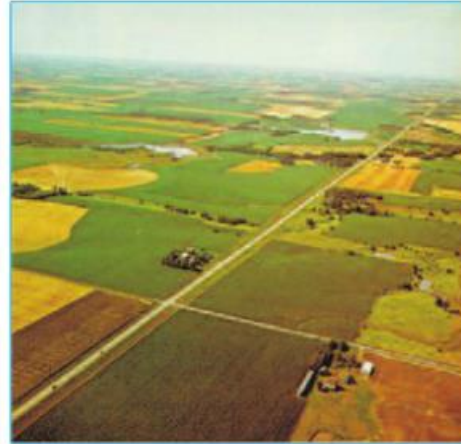
Hình 14.2 - Quang cảnh đồng ruộng ở Hoa Kỳ