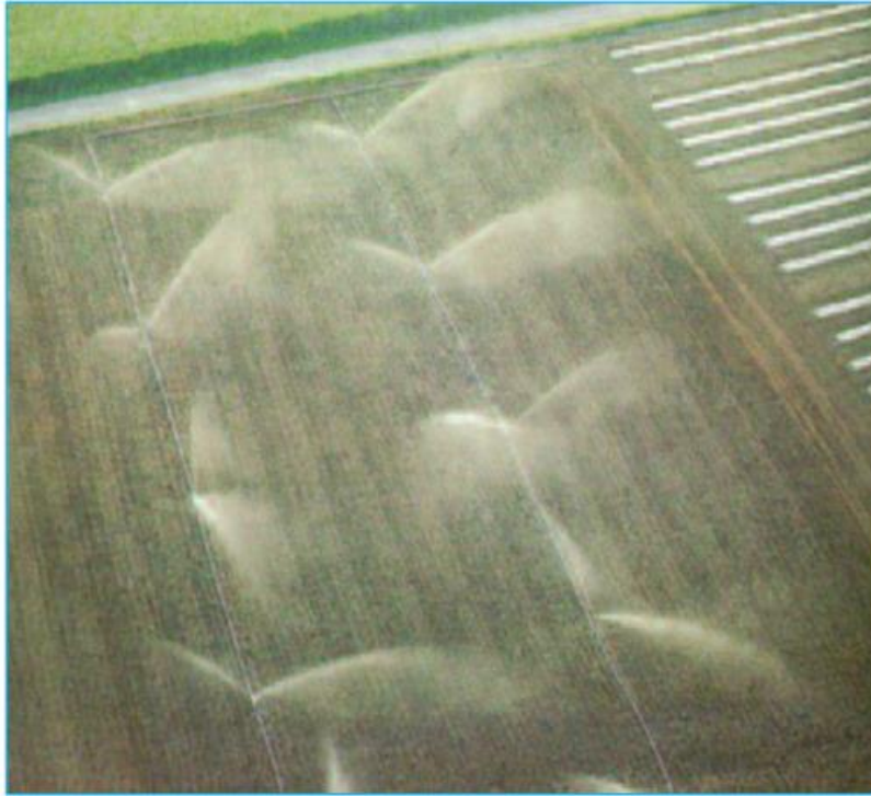
Hình 14.5. Hệ thống tự động phun sương