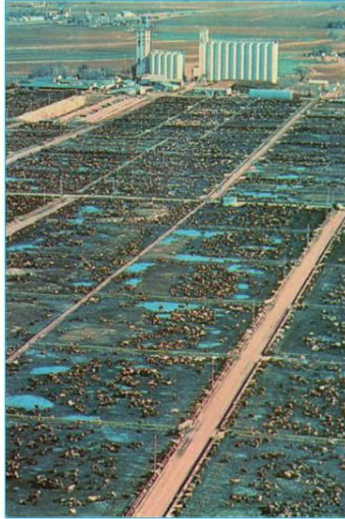
Hình 14.6 - Chăn nuôi bò theo kiểu công nghiệp trong các trang trại ở Hoa Kỳ (Phía xa là các nhà máy chế biến thức ăn)