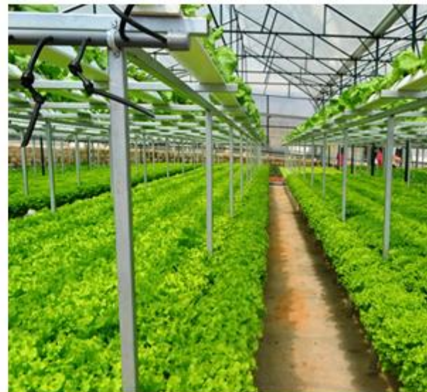
Hình 27. Trang trại nuôi cừu và trồng rau sạch