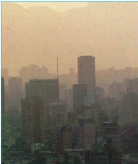
Hình 16.3 - Khói bụi tạo thành lớp sương mù bao phủ bầu trời