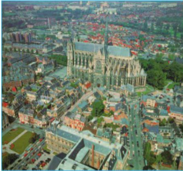
Hình 16.1 - Đô thị cổ A-miêng (Pháp)