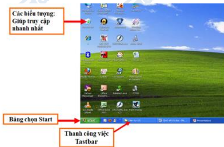
hình 41. Màn hình nền