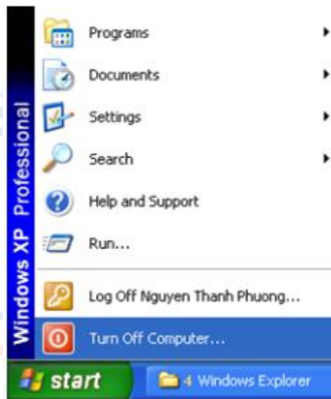
hình 42. bảng chọn Start