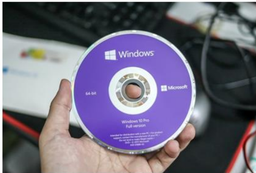
hình 34. đĩa cài hệ điều hành