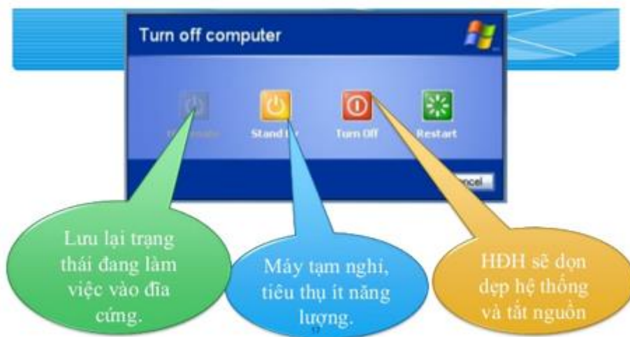
hình 38. các chế độ ra khỏi hệ thống

CLICK NGAY vào TẢI VỀ dưới đây để download giải bài tập Tin học Bài 12: Giao tiếp với hệ điều hành SGK lớp 10 hay nhất file word, pdf hoàn toàn miễn phí.