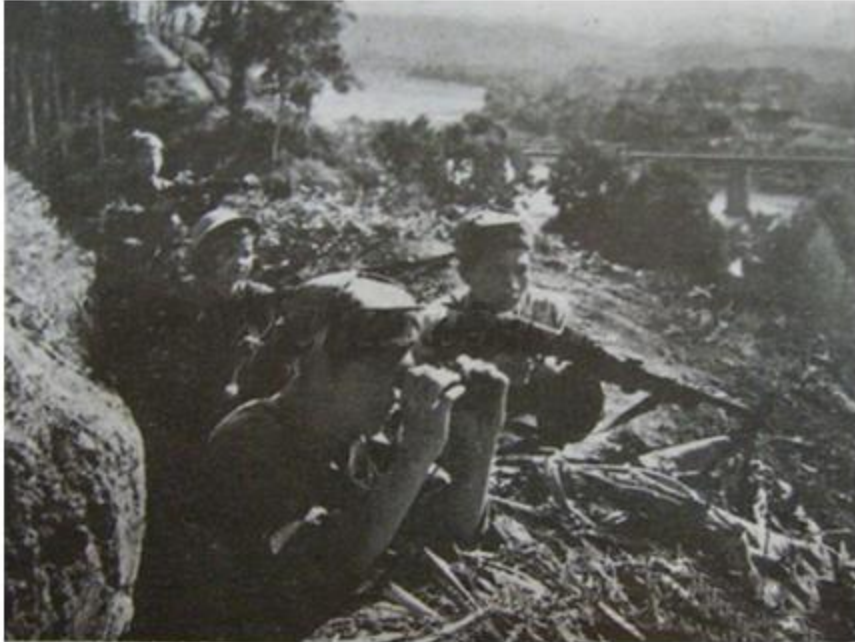
Quân dân địa phương phối hợp chiến đấu bảo vệ biên giới năm 1979