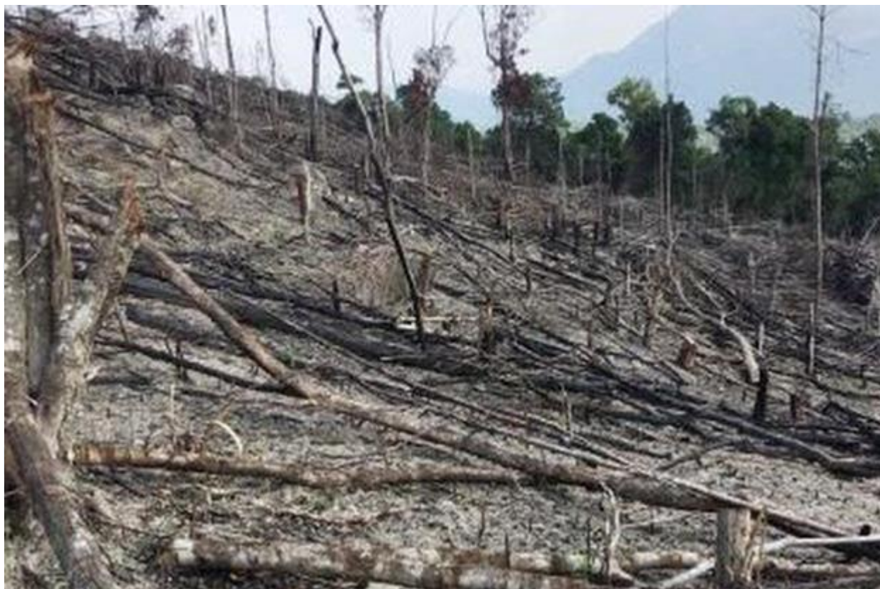
Rừng bị phá hủy để làm nương rẫy

- Nhà nước ta đã ban hành nhiều chính sách và luật để bảo vệ và phát triển tài nguyên rừng.