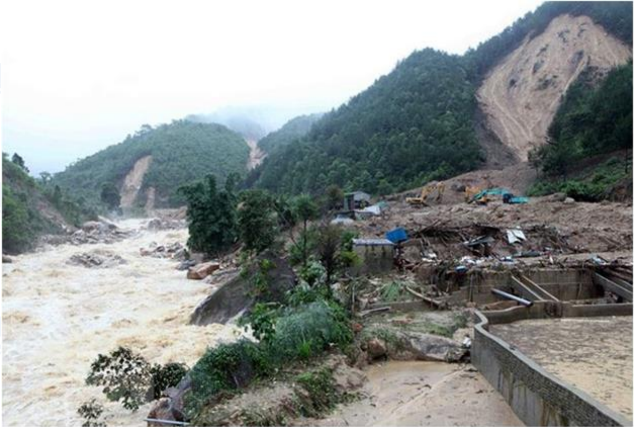
Lũ quét ở Lai Châu

CLICK NGAY vào TẢI VỀ dưới đây để download giải bài tập Địa lý Bài 42: Miền Tây Bắc và Bắc Trung Bộ SGK lớp 8 hay nhất file word, pdf hoàn toàn miễn phí.