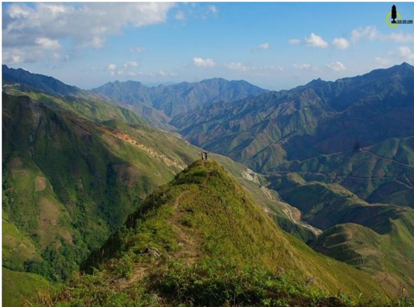
Vùng núi Tây Bắc cao đồ sộ nhất cả nước

- Các mạch núi lan ra sát biển, xen với đồng bằng chân núi và những cồn cát trắng.