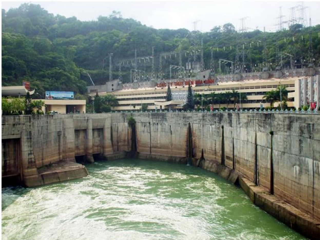
Vùng có tiềm năng thủy điện rất lớn