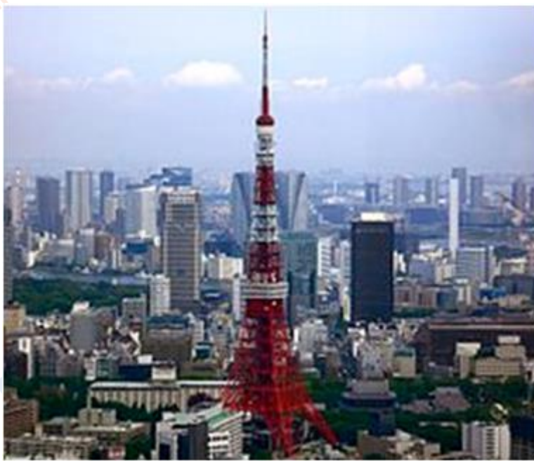
Thành phố Tôkiô của Nhật Bản