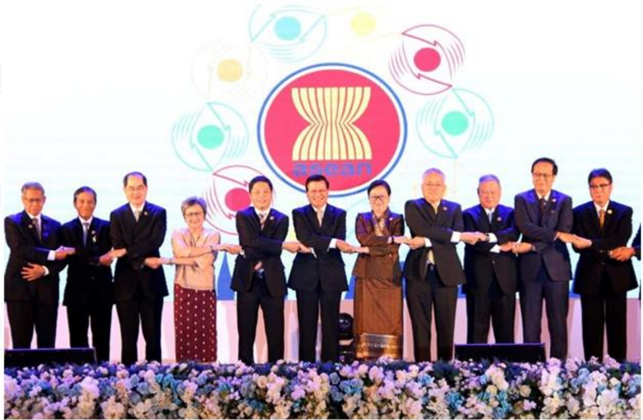
Hợp tác giữa các quốc gia thành viên ASEAN