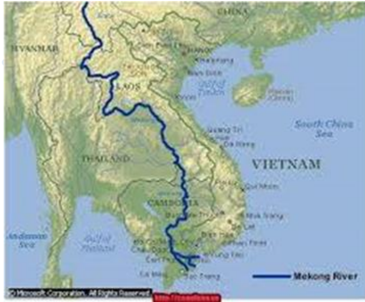
Hợp tác tiểu vùng sông Mê Công