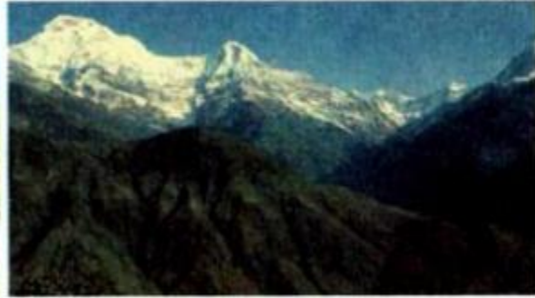
e) Dãy núi Hi-ma-lay-a (phần thuộc Nê-pan)