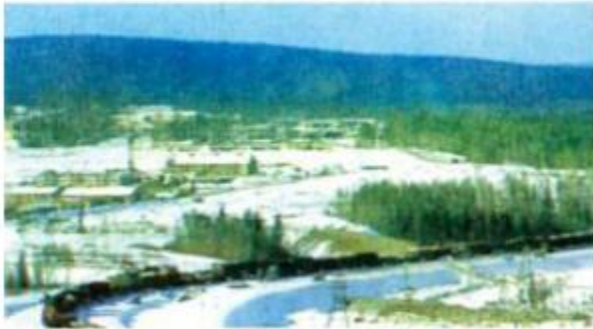
d) Rừng tai-ga (LB. Nga)