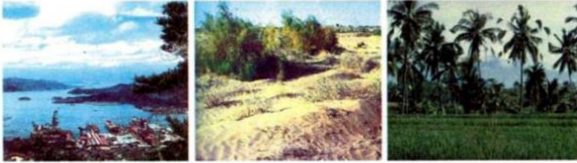
a) Vịnh biển (Nhật Bản)