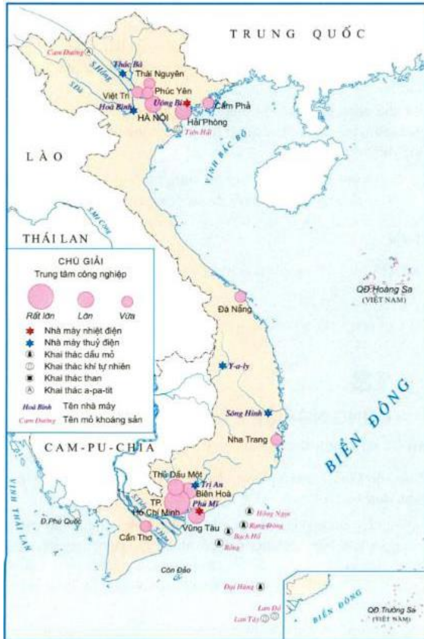
Hình 3. Lược đồ công nghiệp Việt Nam

Dựa vào hình 3, trang 94 SGK, em hãy hoàn thành bảng sau: