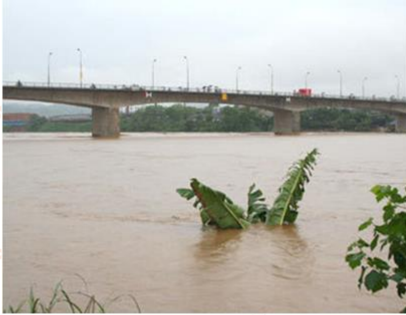
Lũ trên sông Hồng

d) Sông ngòi nước ta có lượng phù sa lớn