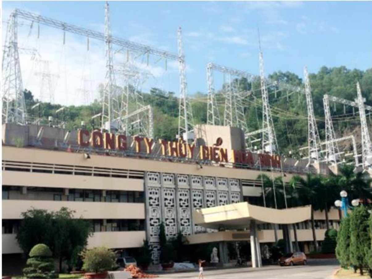
Nhà máy thủy điện Hòa Bình trên sông Đà

Hệ thống thủy lợi để cung cấp nước cho sản xuất nông nghiệp