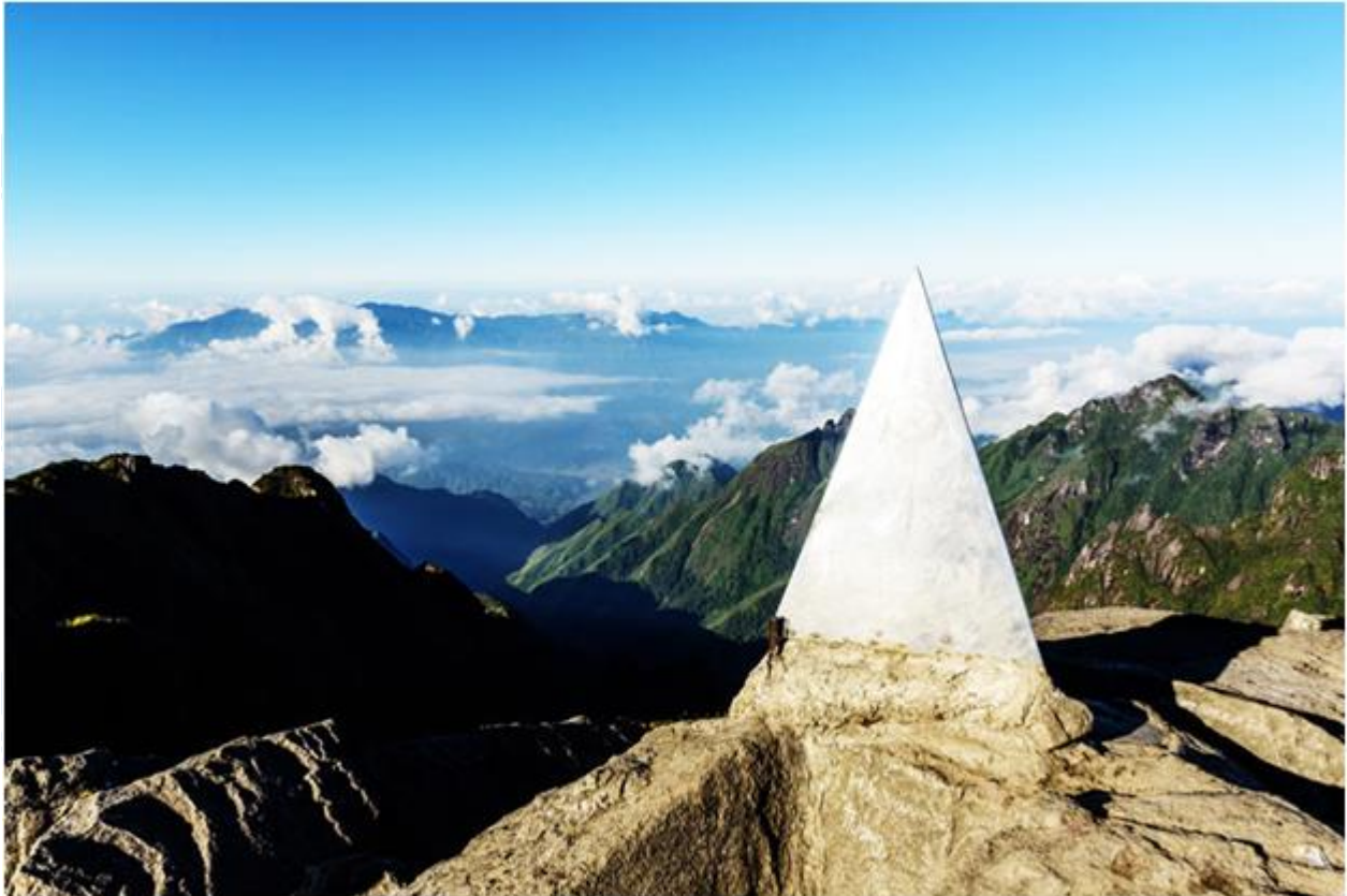
Đỉnh Phan-xi-phăng được coi là nóc nhà của Đông Dương