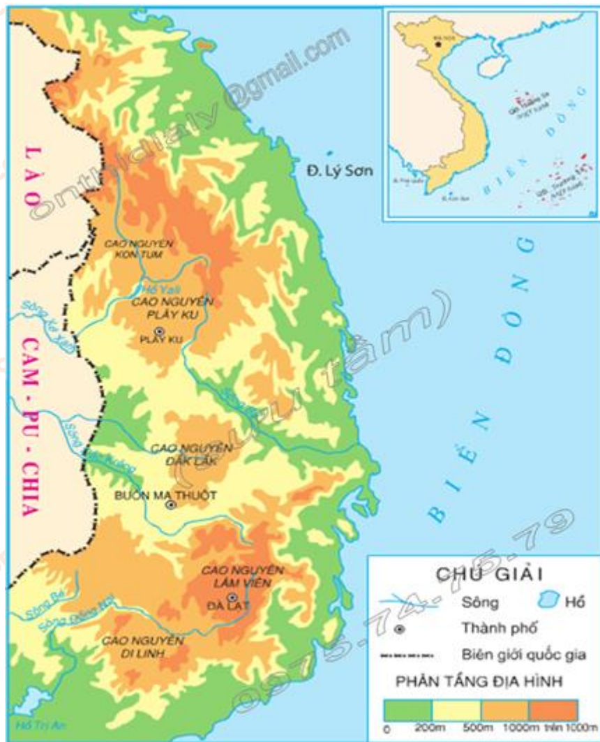
Vùng núi Trường Sơn Nam