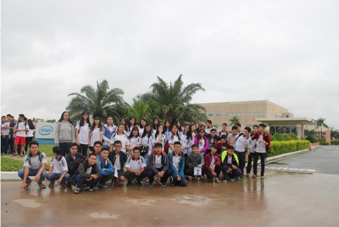
Học địa lí thông qua các thăm quan học ngoại khóa

CLICK NGAY vào TẢI VỀ dưới đây để download giải bài tập Địa lý Bài 22: Việt Nam - đất nước, con người trang 78, 79, 80 SGK lớp 8 hay nhất file word, pdf hoàn toàn miễn phí.