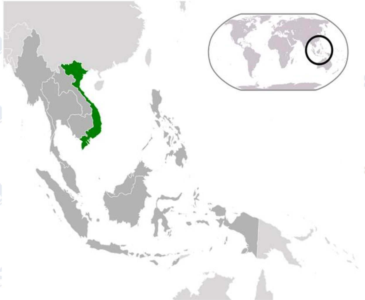
Việt Nam trong khu vực và trên thế giới