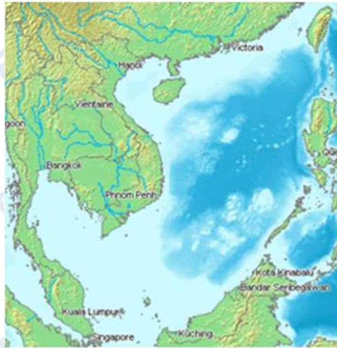
Vùng Biển Đông