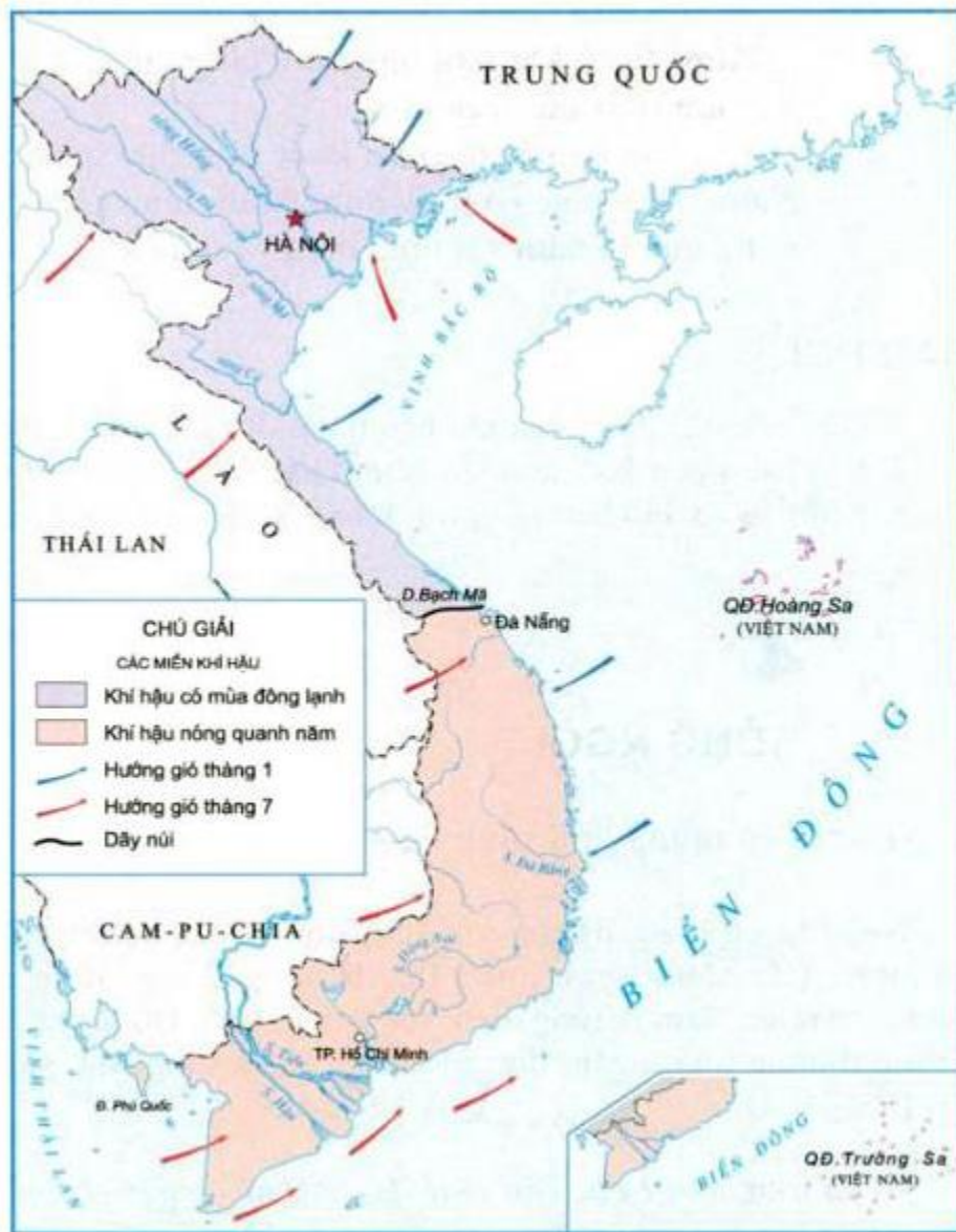
Hình 1. Lược đồ khí hậu