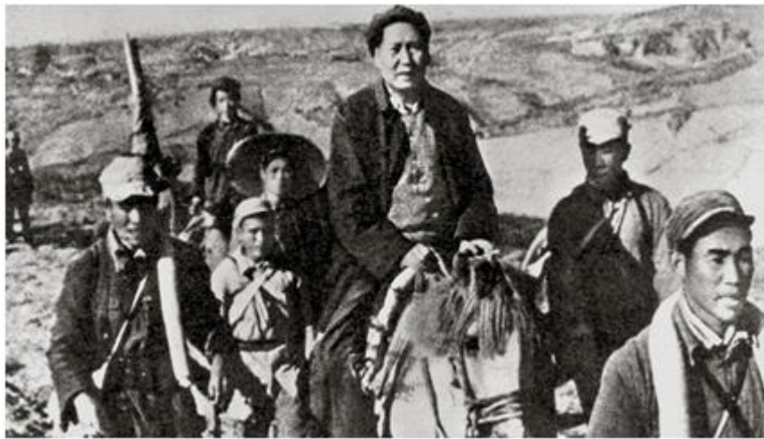
Mao Trạch Đông trong cuộc vạn lý trường chinh

+ Tháng 10/1934: Quân cách mạng phá vây rút khỏi căn cứ tiến lên phía bắc (Vạn lý Trường Chinh).