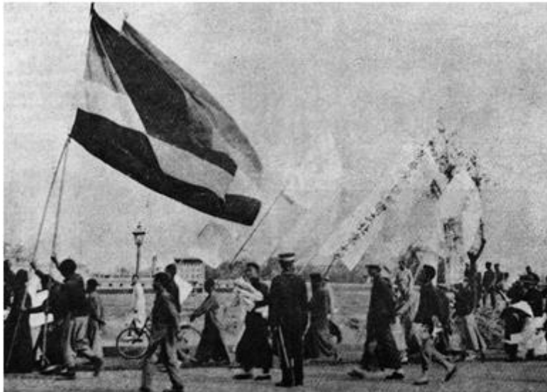
Học sinh, sinh viên biểu tình trong Phong trào Ngũ tứ

* Lực lượng tham gia: Học sinh, sinh viên, nhân dân lao động.