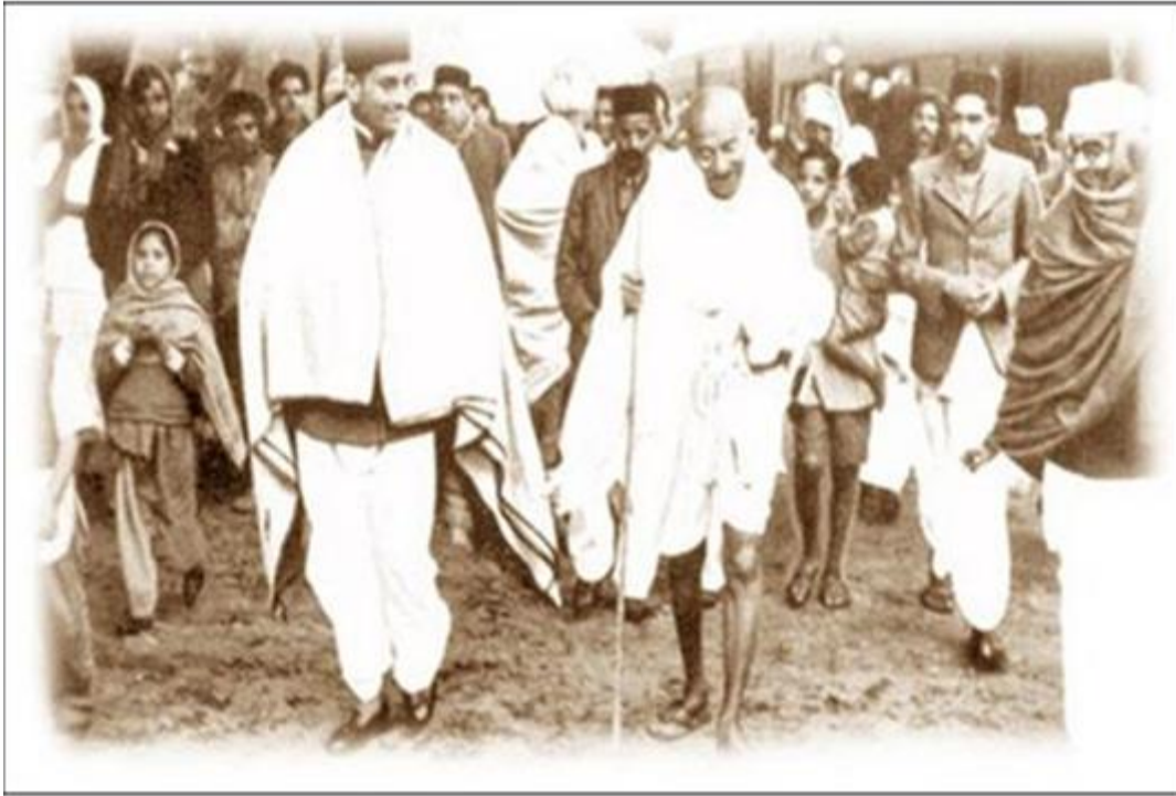
Cuộc đi bộ của M.Gan-đi

- Tháng 12 -1931, Gan-đi phát động chiến dịch bất hợp tác mới.