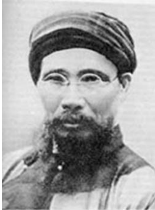
Phan Bội Châu