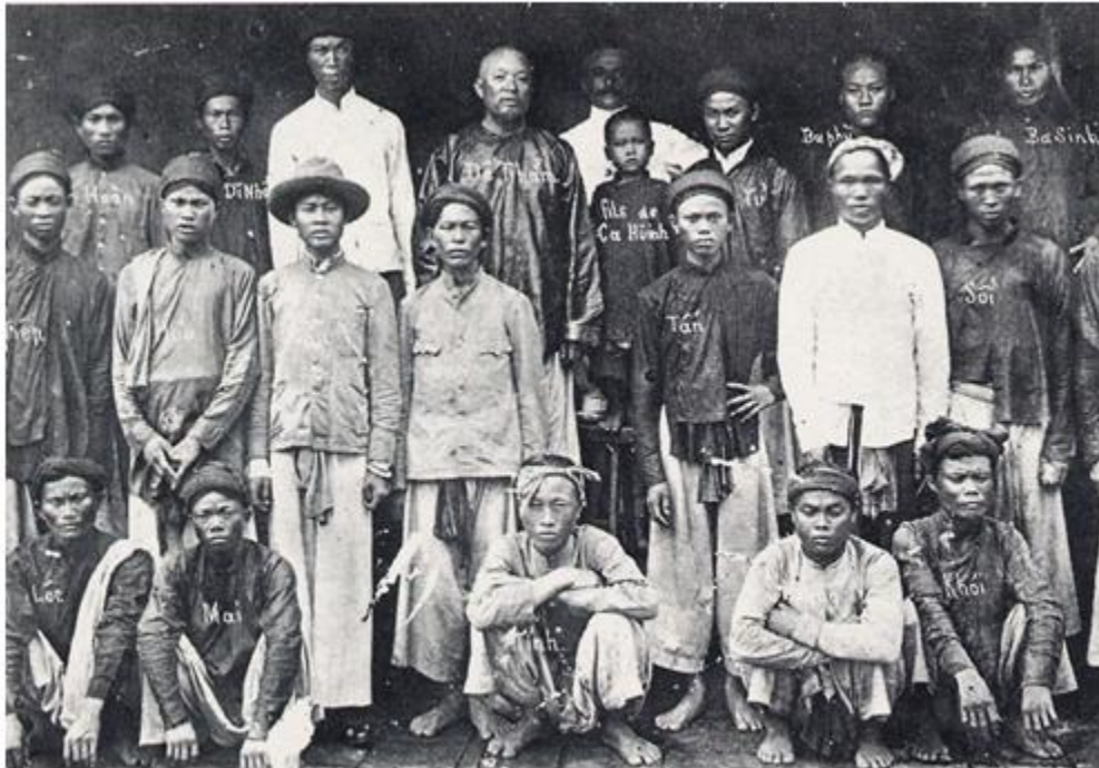
Một số tướng lĩnh của nghĩa quân Yên Thế

- Cuối tháng 1/1909, quân Pháp gồm 15 000 lính tấn công vào căn cứ Phồn Xương ⇒ Nghĩa quân Yên Thế chiến đấu quyết liệt, tháng 2/1913, Hoàng Hoa Thám bị tay sai của Pháp giết hại, nghĩa quân Yên Thế tan rã.