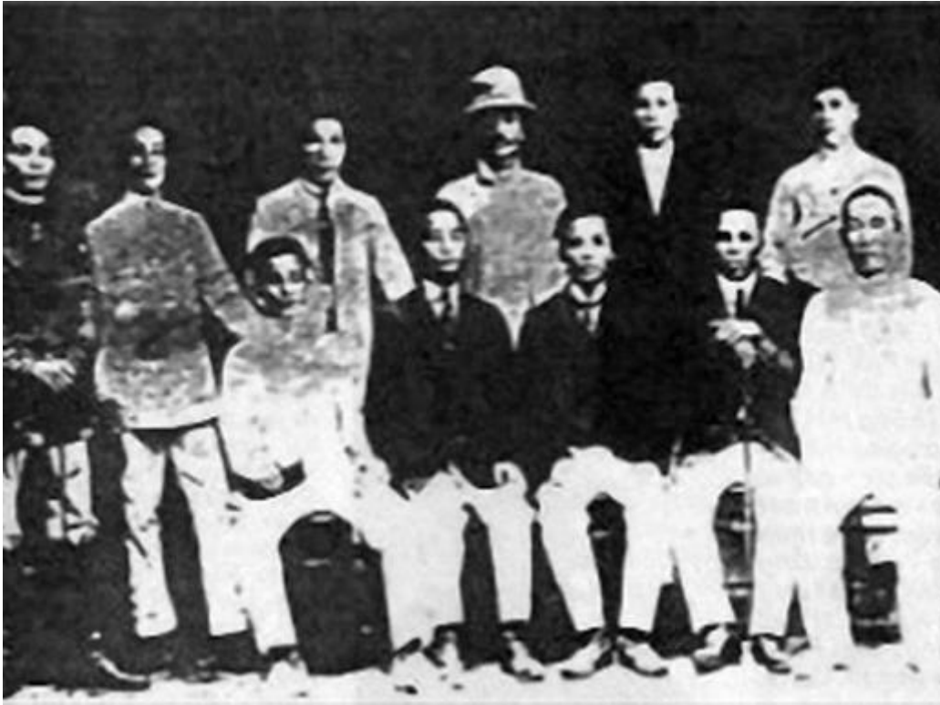
Một số học sinh trong phong trào Đông du

- Tháng 8-1908, Nhật Bản câu kết với thực dân Pháp ở Đông Dương, trục xuất lưu học sinh Việt Nam ⇒ Phong trào Đông du tan rã.