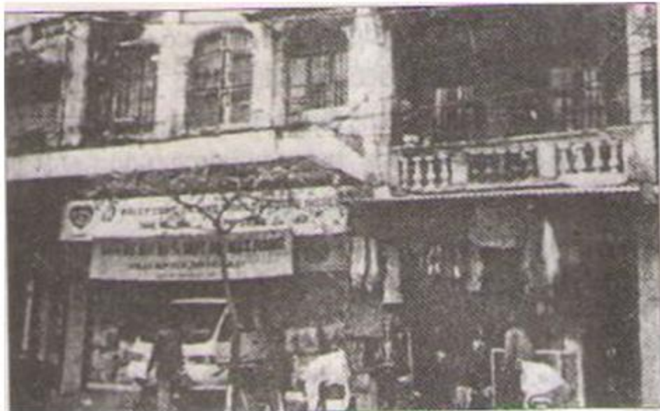
Trụ sở của Đông kinh nghĩa thực