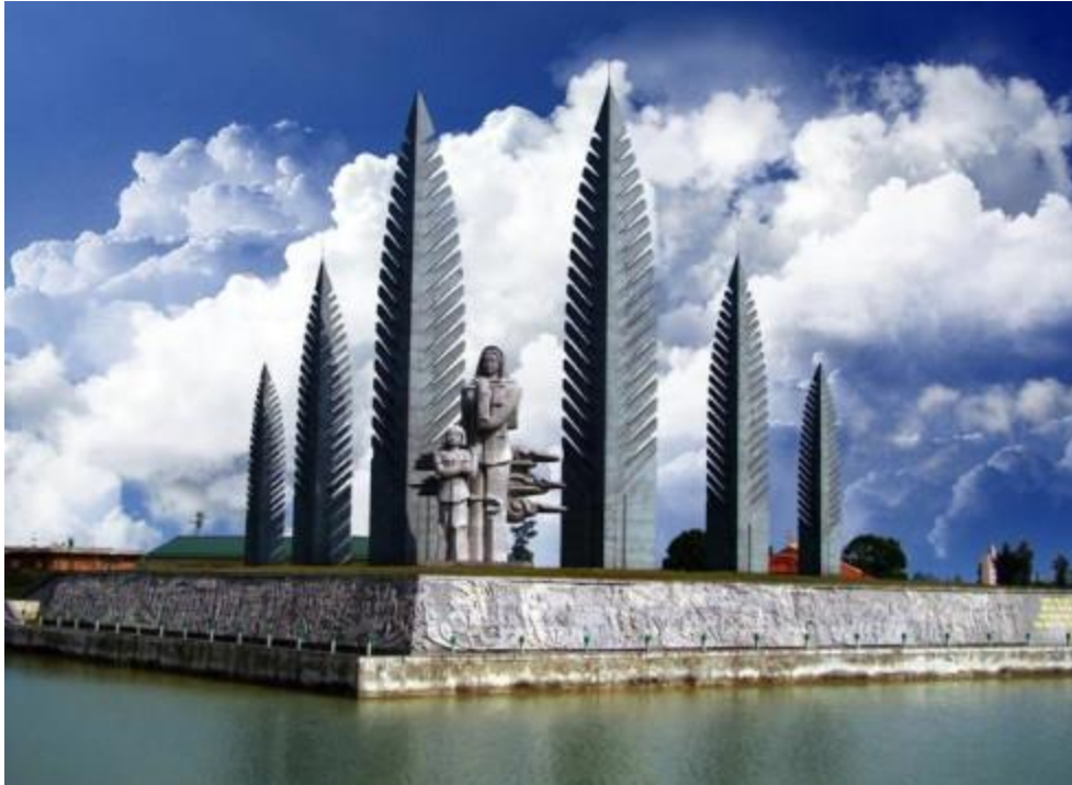
Tượng đài “Khát vọng thống nhất”

Tượng đài “Khát vọng thống nhất” được xây dựng bên bờ Nam sông Bến Hải