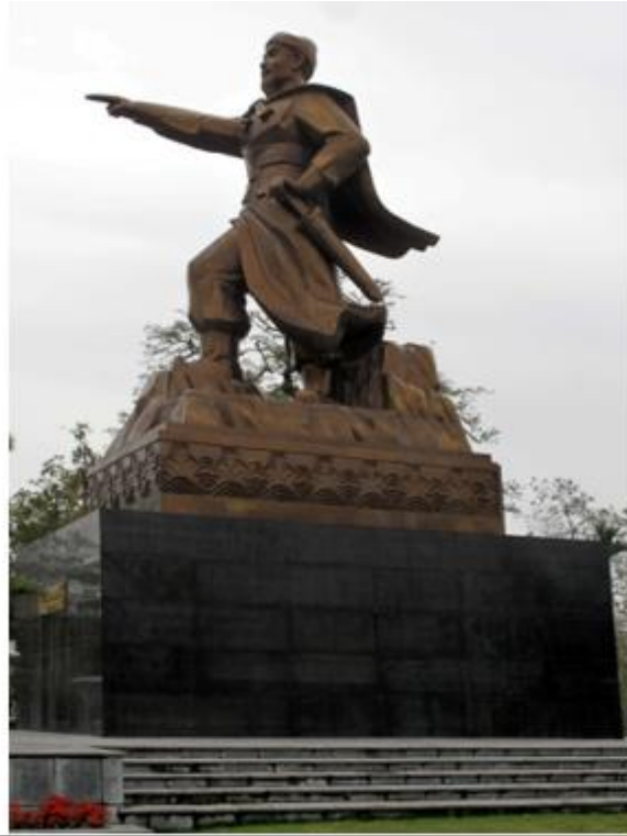
Tượng đài Ngô Quyền ở An Hải – Hải Phòng