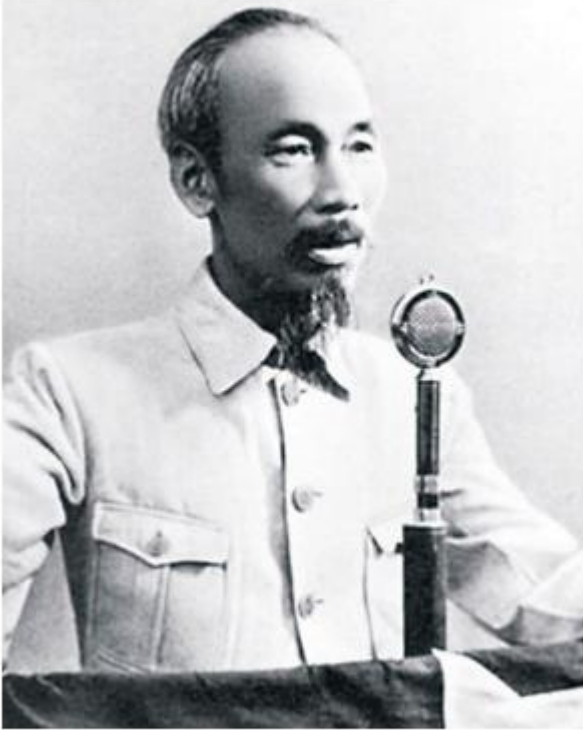
Ảnh Bác Hồ đọc Tuyên ngôn Độc lập

Em hãy cho biết hai hình ảnh trên liên quan đến hai sự kiện lịch sử nào?