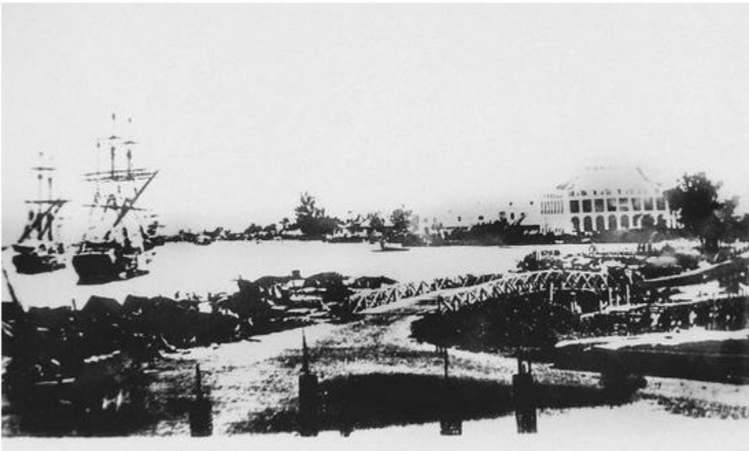
Ảnh bến cảng Nhà Rồng

Dưới đây là hai tấm hình lịch sử tiêu biểu có liên quan tới cuộc đời cách mạng cứu nước của Bác Hồ: