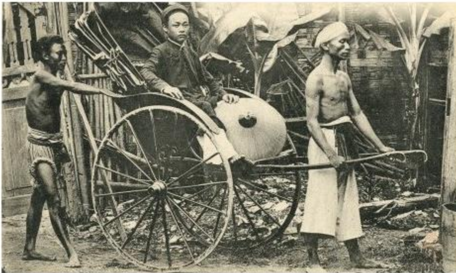
Hình 2. Phu kéo xe thời Pháp thuộc

Hãy nêu cảm nghĩ về tình cảnh người nông dân Việt Nam cuối thế kỉ XIX – đầu thế kỉ XX.