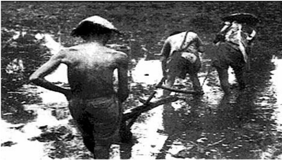
Hình 1. Kéo cày thay trâu