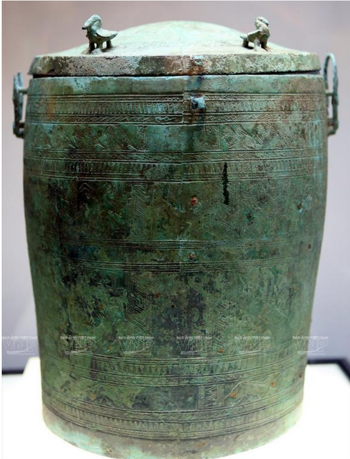
Thạp đồng Đào Thịnh (Yên Bái)