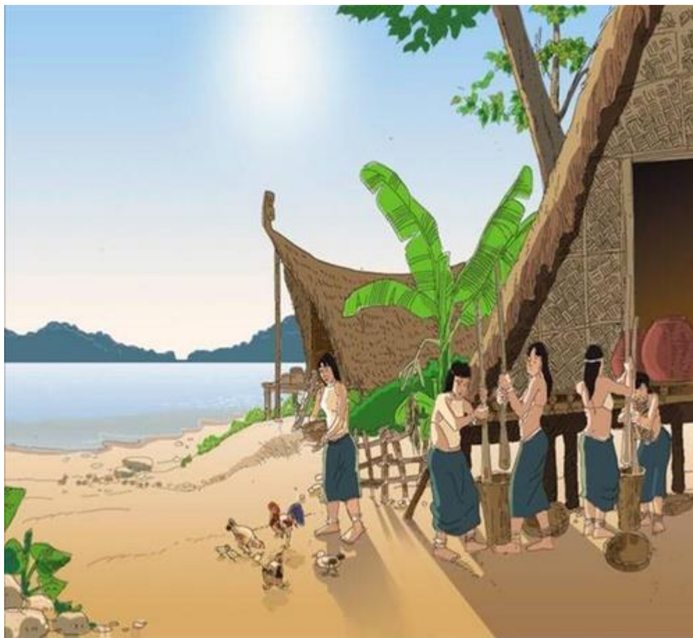
Hình ảnh mô phỏng đời sống của cư dân Văn Lang